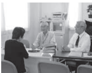
麻生市民交流館やまゆりの相談窓口