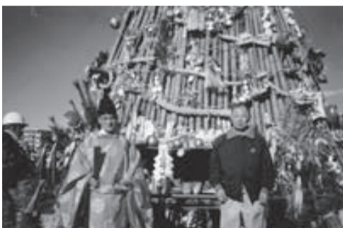
左義長(どんど焼き)での記念撮影

9月の敬老会では、フラダンスや子ども会の方たちにも参加していただき、合唱やビンゴゲームで楽しんでいきます。左義長は、11月20日前後の日曜日に、山から笹の刈り、竹出しなどを町内の各団体に協力をお願いして、50名位で行っています。年が明けた1月には、町内総出で組み立てを行っています。点火当日になると、町内の人たちや近隣地区の方たち、約500名位の方たちがダンゴ焼きをして楽しんでいきます。今後も伝統行事をしっかりと守っていきたいと思います。