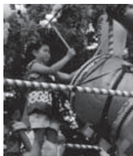
盆踊り大会で太鼓を叩く子ども

当町内会は、麻生区で一番南に位置し、横浜市青葉区との市境に接しており、会員数は約200世帯の小さな町会です。この地域の特色として、町内会の区域の半分を早野聖地公園が占め、その全域が市街化調整区域に指定されており、宅地造成・家の建