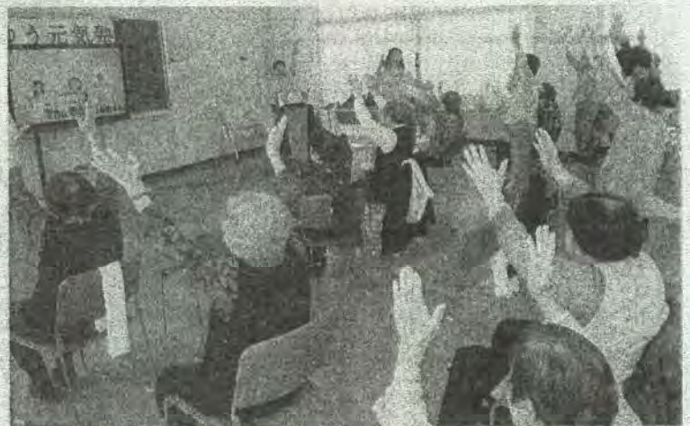
「高原列車は行く」を歌いながら、テレビ画面に映し出されるモデルの動きにあわせて手足を動かすお年寄りたち(東京都清瀬市)