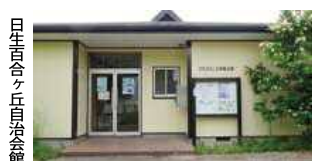
日生百合ヶ丘自治会館

の再開、又「自治会の地縁団体化」等、問題は山積みですが、自治会の皆様のお力をお借りしながら、素晴らしい住環境を維持し、安全で、安心して暮らせる町づくりを目指して行ければと願っております。