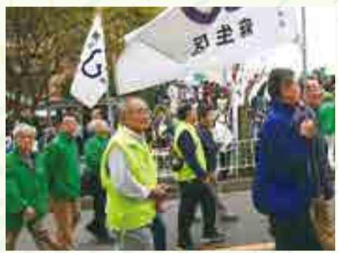
あさお区民まつりに参加

の大きな変化が予想されます。今後、ウイズコロナをどう受け入れていくか、さらに高齢化や世代間の交流、そして地域環境の変化の中で、ご近所同士が親睦を深め、助け合い、安全で安心、住み良い町づくりを持続的に継続していけるかが課題と考えています。