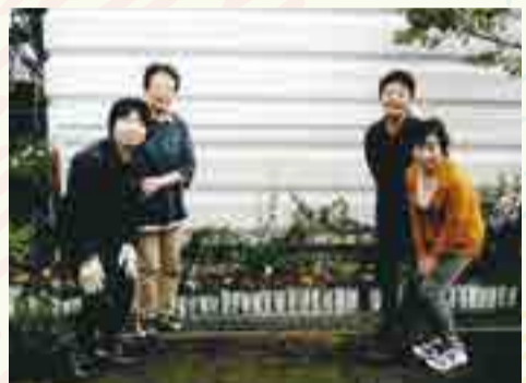
花壇のある憩いの場

建て替え工事が完了した新1号棟事に入りました。この度完了した新1号棟は近代的であり、自然災害の地震、暴風雨などに強いそうです。今は5号棟の解体作業中で、全棟完了には14、5年かかるようです。団地は小さな合衆国です。無事、安穩の日々を満喫できるよう、皆で力を合わせ誠心誠意頑張っていきたいと考えています。