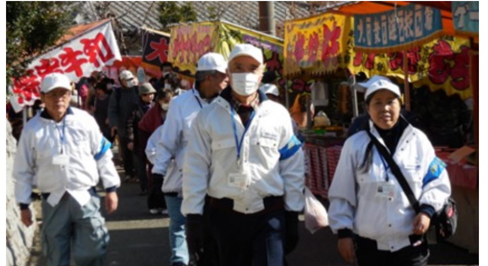
愛のパトロールの様子