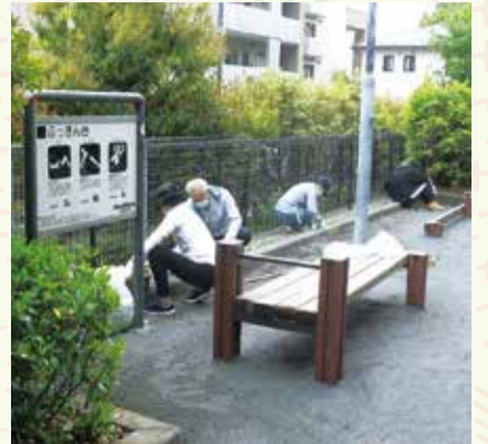
提供公園の草取り