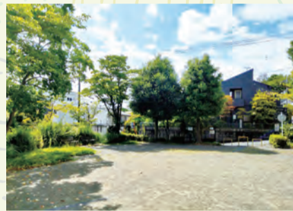
憩いの場 源内谷公園

現在62世帯が住むコンパクトな住宅地となっています。春先には、自治会の集会が行われ活動報告を交えながら、皆さんの歓談の音が響きます。町内の清掃、ハロウィーンなど、コロナ禍で集