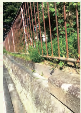
補修予定の石垣(美山台中公園)

今年度の活動としては、防犯の観点から昨年設置された防犯カメラの運用を開始しました。また、自治会組織の効率化の目的で、複数あって運用の妨げになっていた銀行口座を統合しました。さら