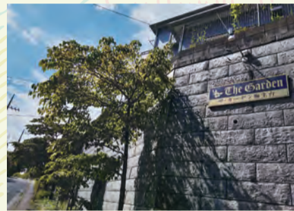
ザ・ガーデン麻生台 入口 看板

ザ・ガーデン麻生台は、小田急線柿生駅から南側に歩いて10分ほど、柿生中学を過ぎると右手側に「ザ・ガーデン麻生台」の看板が見え、右手に曲がったところが、わたしどもの住宅街となります。中央に源内谷公園があり、大きな桜の木と街路樹にはハナミズキが植えられ、花が咲く春先には鮮やかな景観を見せてくれます。早朝から鳥の鳴き声が聞こえ、昼間でも車の交通量が少ないので、静穏な落ち着いた空間となっています。