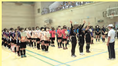
女子バレーボール大会の様子

スポーツ推進委員は、スポーツ基本法に基づき、地域のスポーツ振興にかかわる活動を行っています。全国で約5万人おり、麻生区では、町会・自治会からの推薦により、川崎市長から委嘱を受け、44名(令和5年2月1日現在)のスポーツ推進委員が活躍しています。スポーツを地域に浸透させるサポーターとしての役割を担い、主催事業の他、各地域におけるニュースポーツの振興や実技指導など、世代を超えてスポーツに親しめる地域づくりに努めていて、最近ではポッチャードローンサッカー®など新たな取組みの紹介も行っていきます。スポーツ推進委員への協力依頼や委員会活動に興味