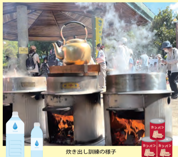
炊き出し訓練の様子

王禅寺ふるさと公園で催される「麻生区ふれあい公園」というイベントで炊き出し訓練をしています。ここには非常に多くの方が集まり、炊き出しにも長蛇の列ができます。1,000食の炊き出しは苦労も多いですが、このように多くの方が集まることが、災害時の混乱に対処する練習になります。現在では5つの町会で炊き出し訓練を行っていますが、町会同士が知り合うきっかけにもなり、連携もよくなるのではと考えています。